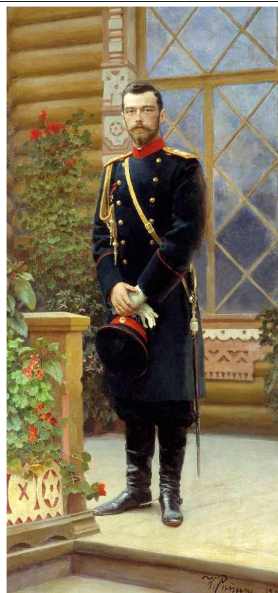
Портрет императора Николая II. 1896. Худ. Илья Репин.