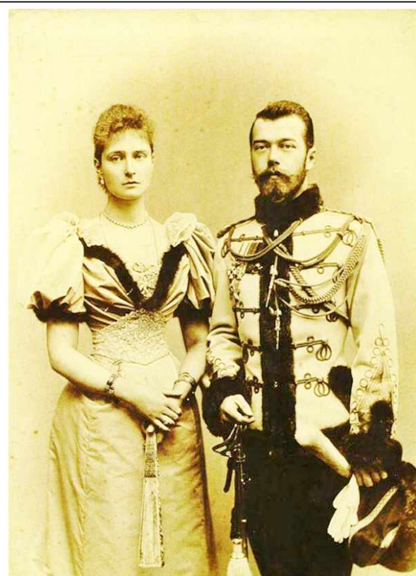
Император Николай II и императрица Александра Фёдоровна. 1896 г.

В своем первом публичном выступлении перед земскими дворянами, прибывшими поздравить