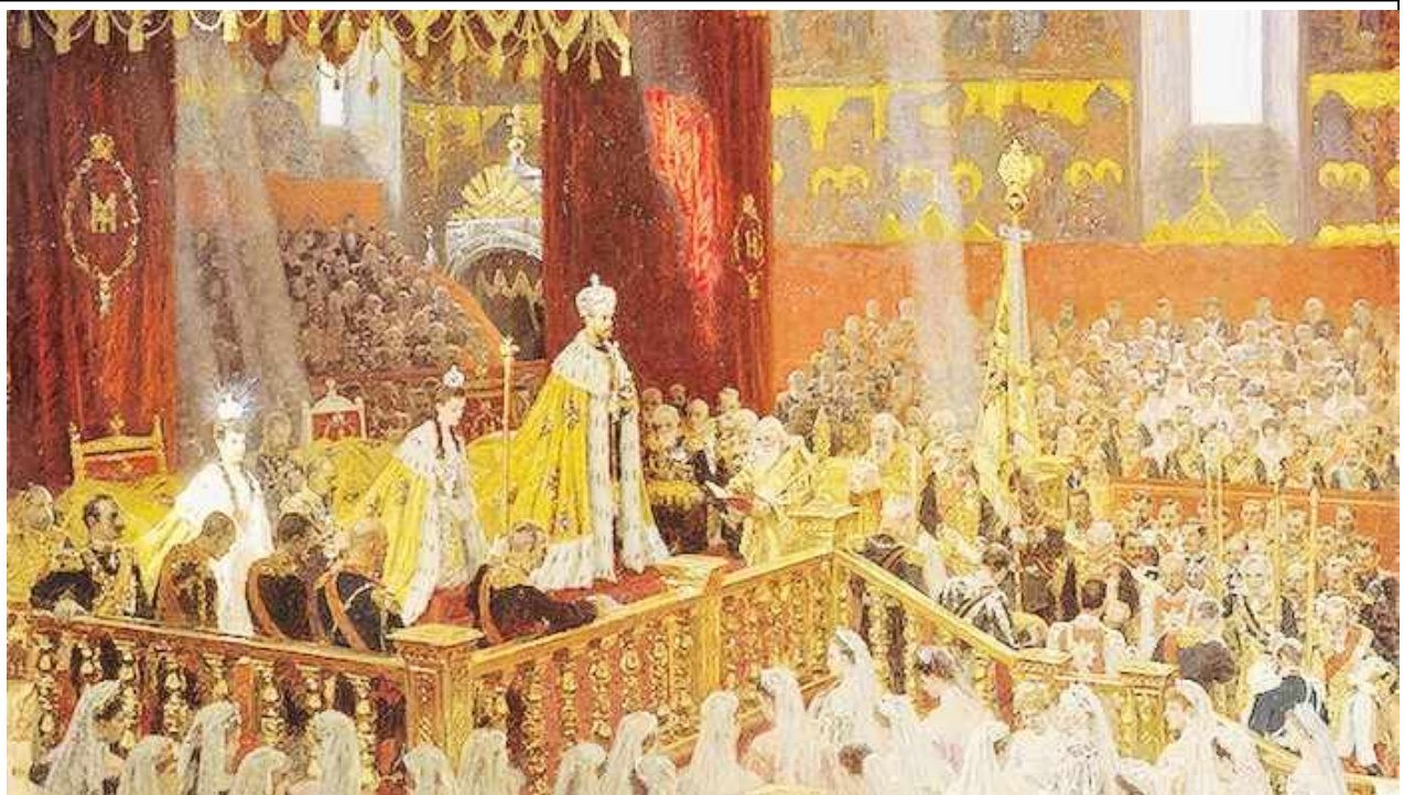
Коронация императора Николая II Александровича и императрицы Александры Фёдоровны.

Коронация императора Николая II Александровича и императрицы Александры Фёдоровны состоялась 14 мая 1896 года в Успенском соборе