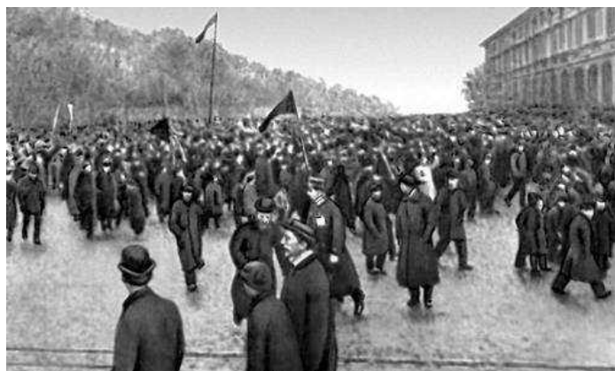
Демонстрация рабочих и студентов (Петербург) - 1905 г.

На предыдущих уроках мы говорили о том, как формировалось в России революционное движение. Его истоки прослеживаются, начиная со Смутного времени, когда в Москву стал проникать инородный дух западничества. При царе Алексее Михайловиче произошел «культурный