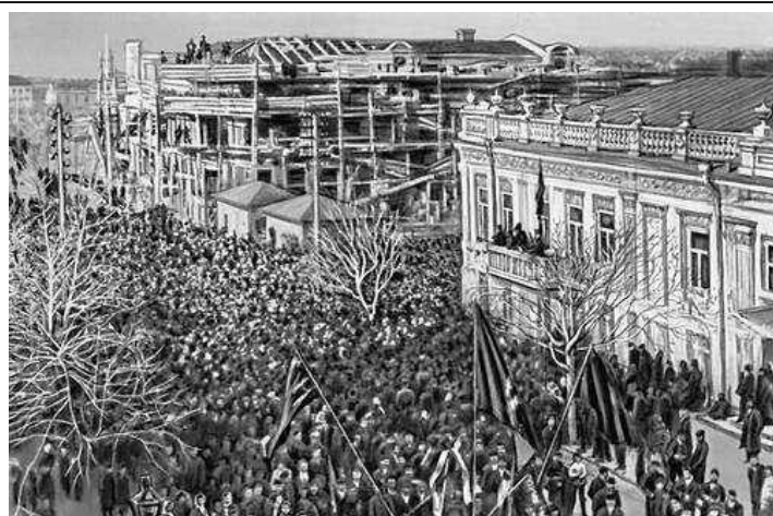
Демонстрация трудящихся в Новороссийске. Декабрь, 1905 г.

Консерваторы (или правые) считали, что назревшие перемены можно осуществить без ломки традиционных устоев русской жизни, главные из которых – православная вера, самодержавная монархия, любовь народа к царю и Отечеству. Наоборот, проводя общественные преобразования, надо всячески охранять эти устои и опираться на них. Консерватором был, прежде всего, сам