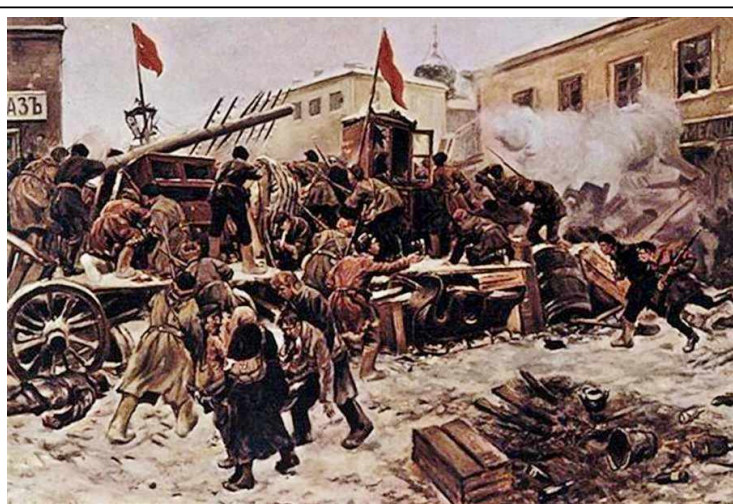
Баррикады на Пресне. 1906 г. Художник И.А.Владимиров

Однако эта мера не смогла усмирить революционеров. С сентября начался новый подъем рабочего движения, переросший в октябре во всероссийскую октябрьскую политическую стачку. В ней участвовало до 2