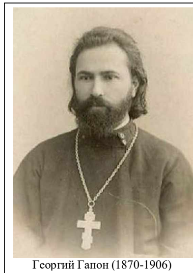
Георгий Гапон (1870-1906)

с Гапоном направилась к Зимнему дворцу. В город ввели войска, установили заслоны на основных улицах, не позволяя рабочим