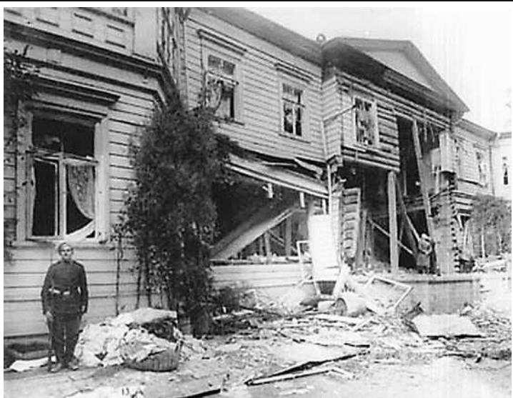
Дача Столыпина после теракта 12 августа 1906 г.

искалечена 14-летняя дочь и ранен трехлетний сын Столыпина. Премьер-министр остался невредим.