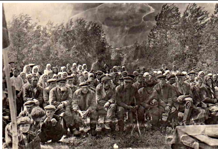
Сход сельской общины в Самарской губернии (ок. 1903)

ним наделы и мог требовать, чтобы они были сведены в один участок (хутор).