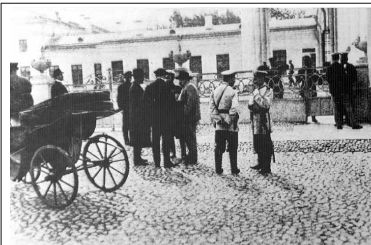
Полиция у Таврического дворца после роспуска 1-й Думы.

более революционной, чем 1-я Дума, так как левые депутаты вели себя крайне агрессивно и использовали думскую трибуну не для обсуждения проектов реформ, а для пропаганды против правительства. 3-го июня 1907 года 2-я Дума также была распущена. ЭТОТ ДЕНЬ СЧИТАЕТСЯ КОНЦОМ РЕВОЛЮЦИИ 1905-1907 гг.