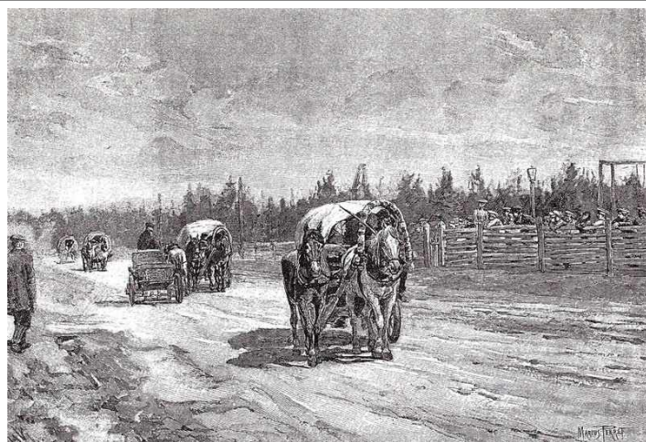
Переселенцы в пути

В первые годы реформы переселение развивалось быстрыми темпами. Затем этот процесс несколько замедлился. Всего с 1906 по 1914 год в Сибирь переселились 3 млн. 40 тыс. человек. Однако переселенческое ведомство плохо подготовилось к перевозке и устройству на новых местах огромной массы людей, и часть переселенцев возвратилась в места прежнего проживания (около 17 %).