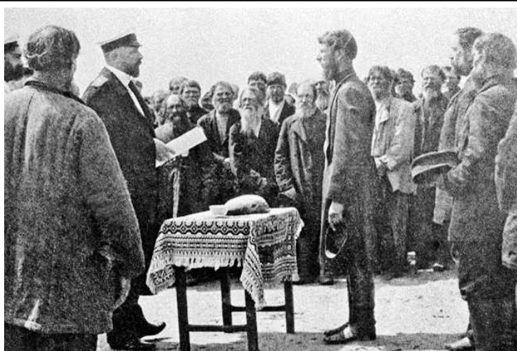
Столыпин принимает рапорт у волостного старшины

Семь лет энергичных реформ дали заметные результаты. Посевные площади возросли в целом на 10%. Хлебный экспорт увеличился на треть, достигнув в среднем 25% мирового экспорта зерна, а в урожайные годы – 40%. Развитие сельского хозяйства, в свою очередь, влияло на промышленный рост, темпы которого в эти годы были самыми высокими в мире (8,8 %).