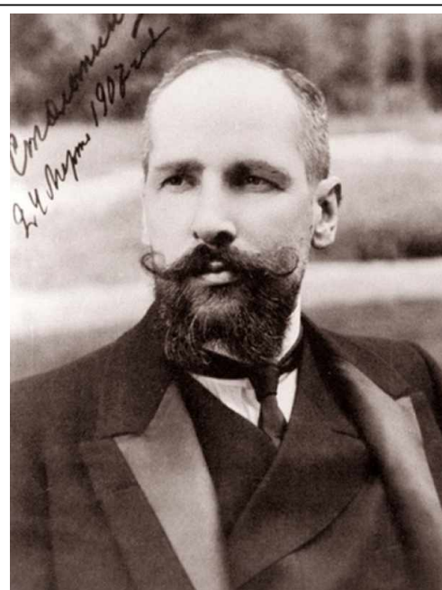
Петр Аркадьевич Столыпин

Его позиция не устраивала террористов-революционеров. 12 августа 1906 года на П.А. Столыпина в Петербурге было совершено покушение. На его дачу явились двое неизвестных в жандармской форме, которые подбросили в дом бомбы страшной разрушительной силы. 27 человек погибли и 32 были ранены. Была