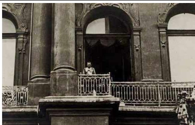
Николай II объявляет о войне с Германией с балкона Зимнего дворца.

В первые месяцы войны всех граждан России объединил патриотический порыв. В стране проходили стихийные манифестации – люди в разных городах России несли русские национальные знамена, портреты Николая II, царевича Алексея, великого князя Николая Николаевича, иконы. Мобилизация прошла