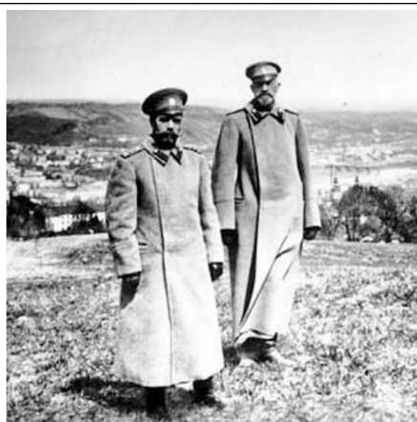
Император Николай II и главнокомандующий, великий князь Николай Николаевич

Русская армия была разделена на два фронта: Северо-Западный и Юго-Западный . 1-й армией командовал генерал Ренненкампф , а 2-й – генерал Самсонов . Верховным