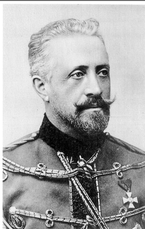
Главнокомандующий Русской армии в начале войны, Великий князь Николай Николаевич

Им стало УБИЙСТВО 15 июня 1914 г. в г. Сараево (столица Боснии) НАСЛЕДНИКА АВСТРО-ВЕНГЕРСКОГО ПРЕСТОЛА эрцгерцога Франца-Фердинанда. В него стрелял сербский националист Гаврило Принцип , который был австрийским подданным. Правительство Австро-Венгрии возложило всю вину на Сербию и 10 июля предъявило ей ультиматум.