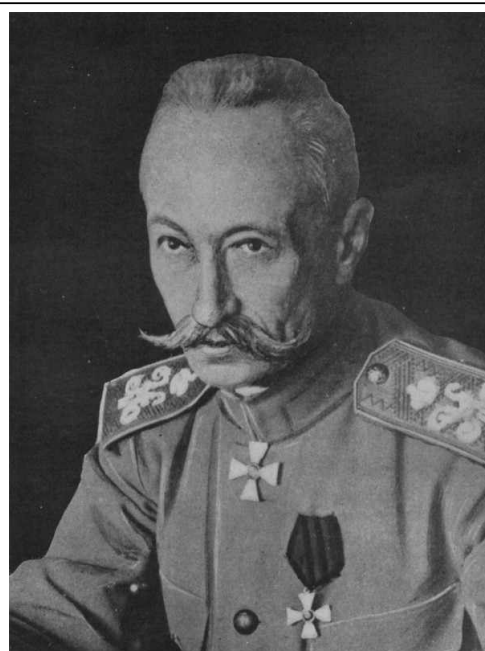
Генерал Алексей Алексеевич Брусилов

За 15 месяцев, прошедших с того момента, когда Николай II встал во главе войск, русская армия добилась серьезных успехов. Она не только больше не отступала, но, напротив, отвоевала часть потерянных территорий на западе. Кроме того, продолжалось наступление против Турции, русские захватили почти всю