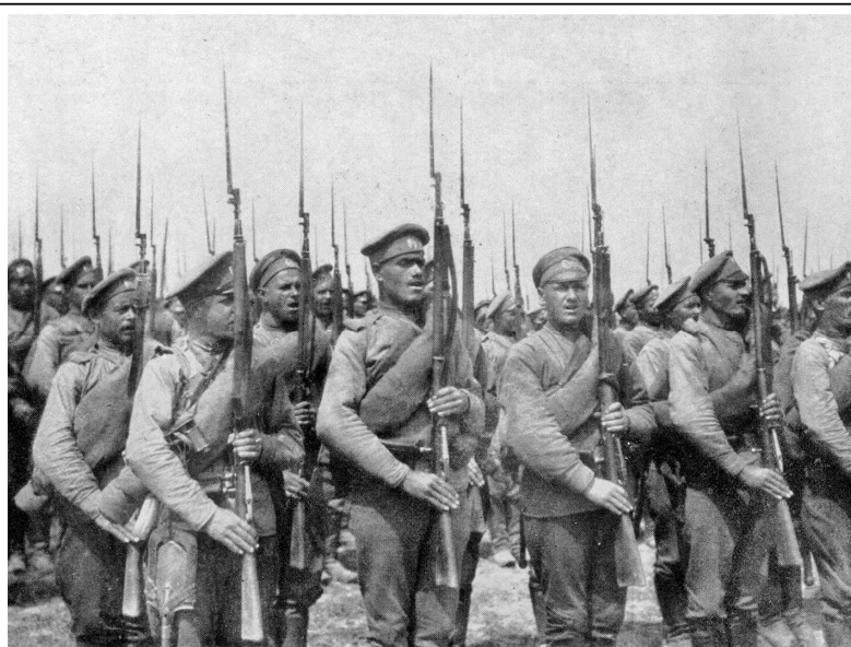
Русская пехота во время Первой мировой войны

1915 год – время суровых испытаний. Немцы понимали невозможность ведения войны на два фронта. Они планировали: на Западном фронте перейти к обороне, а основные же силы сконцентрировать на Восточном фронте, чтобы разгромить русскую армию, а затем покончить с Францией и Англией.