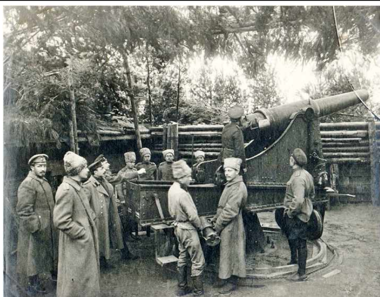
Русская тяжелая артиллерия. Сентябрь 1915 г.

Чтобы улучшить обеспечение русской армии военным снаряжением, в конце мая 1915 г. на съезде представителей торговли и промышленности известный московский предприниматель Я.Рябушинский предложил организовать по всей стране военно-промышленные комитеты . Они должны были привлечь предприятия частной промышленности для работы на нужды фронта. Такие комитеты вскоре были созданы.