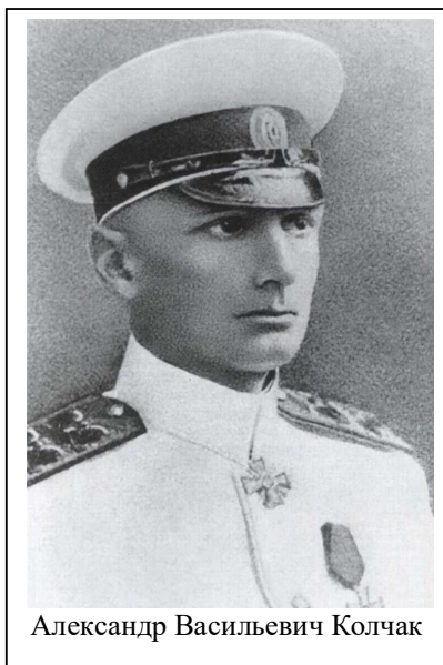
Александр Васильевич Колчак

главе страны предполагалось поставить Совет народной обороны (председатель Л.Г.Корнилов , заместитель – А.Ф.Керенский , члены – генерал М.В.Алексеев , адмирал А.В.Колчак и др.). При Совете народной обороны должно было существовать правительство – представители различных политических партий. Было принято решение, что как только произойдет ожидавшееся «выступление большевиков», занять столицу, обезоружить гарнизон и разогнать Петросовет. 25 августа фронтовые части двинулись на Петроград.