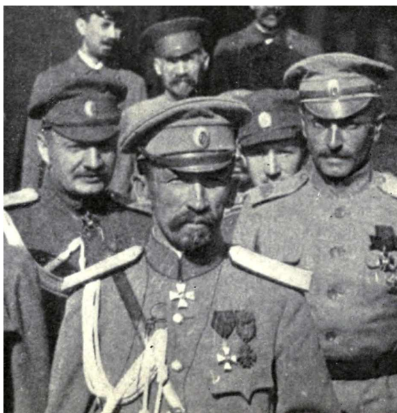
Генерал Корнилов с офицерами, 1917 г.

Были разработаны планы установления в России новой формы правления. Во