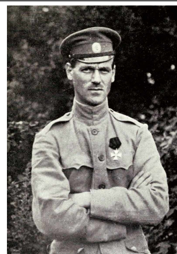
Великий князь Михаил Александрович

Николай II, узнав об ответах командующих фронтами в поддержку отречения, ответил согласием. Он считал, что если интересы Отечества требовали отречения, как утверждали его советники, ему надлежит отказаться от престола. 2 марта 1917 г. император отрекся от престола за себя и за царевича Алексея в пользу своего младшего брата Великого князя МИХАИЛА АЛЕКСАНДРОВИЧА. В этот же день, по сути, свергнутый император записал в своем дневнике: «Кругом измена и трусость и обман». Через несколько дней он был