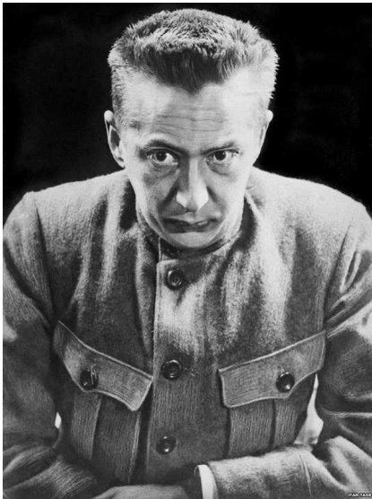
Александр Фёдорович Керенский

Продовольственный кризис. Промышленность производила все меньше товаров, а значит, цены на них увеличивались. В ответ крестьяне стали поднимать цены на продукты, а то и вовсе прекращать их подвоз в города: все равно на вырученные обесцененные деньги стало трудно вообще купить что-нибудь.