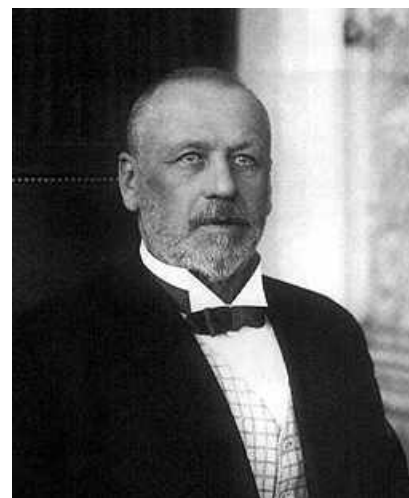
Михаил Владимирович Родзянко

Из представителей левых партий, питерских рабочих и восставших солдат, по примеру 1905 г., был образован Петроградский Совет рабочих и солдатских депутатов , который призвал народ к окончательному свержению власти. Обещаниями скорого мира Совет привлек на свою сторону большинство солдат гарнизона. Силой оружия обманутых солдат и