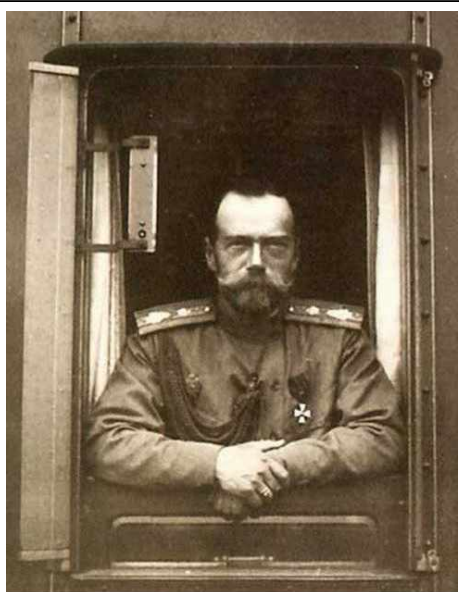
Николай II в окне поезда после отречения 2 (15) марта 1917 г.

Отречение Николая II. Узнав о военном бунте в столице, царь направил туда для восстановления порядка военную экспедицию во главе с генералом Н.И.Ивановым, и сам следом выехал 28 февраля. Однако дорога на Петроград оказалась перекрыта восставшими. Императорский поезд направился в Псков, где располагался штаб Северного фронта. Отряд Иванова был также остановлен.