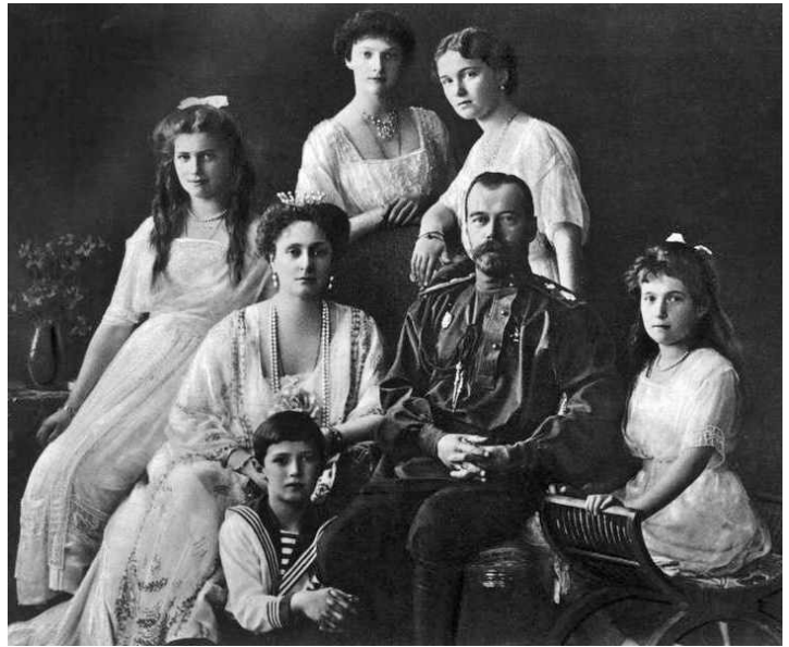
Царская семья: Император Николай II, императрица Александра Федоровна, Великие княжны: Ольга, Татьяна, Мария, Анастасия и цесаревич Алексей.

Провалился декрет о передаче всей власти Советам. Он привел к распаду контролируемой большевиками территории на отдельные части. Некоторые Советы объявляли себя