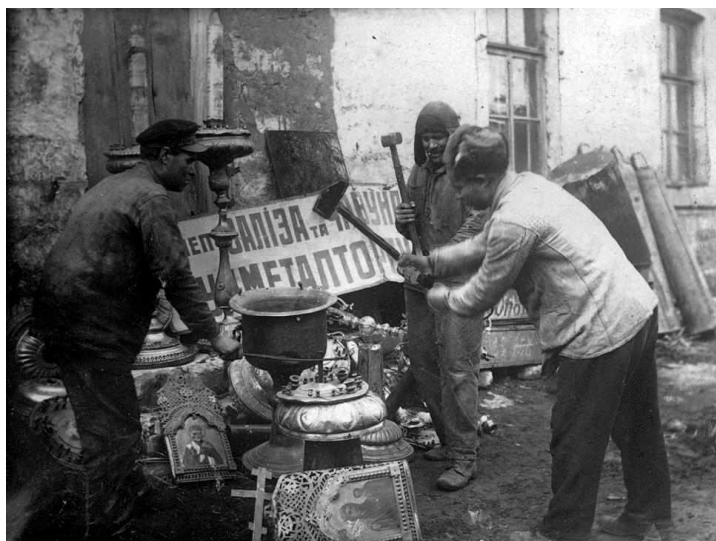
Большевики – сатанисты грабят Церковь.

С политических противников и состоятельных классов расстрелы постепенно были перенесены на всех граждан. При помощи политического террора большевики хотели сломить волю всех своих противников и окончательно узурпировать власть. По словам Ленина «было бы величайшей глупостью полагать, что без принуждения и без диктатуры возможен переход от капитализма к социализму».