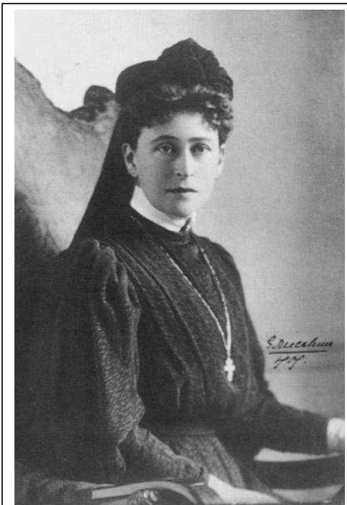
Великая княгиня Елизавета Федоровна.