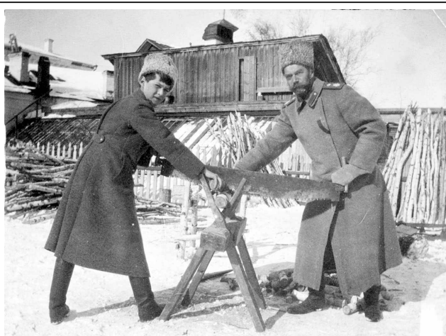
Николай II с цесаревичем Алексеем в ссылке в Тобольске, 1917 г.

Уничтожение царской Династии. До августа 1917 г. семья Николая II находилась под арестом в Царском Селе, а затем была перевезена в Тобольск на Урале, откуда в конце апреля 1918 г. отправлена в Екатеринбург. К этому времени власть в стране уже захватили большевики.