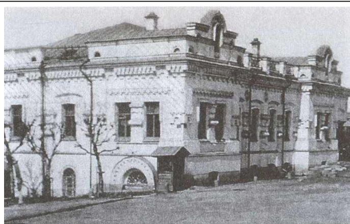
Ипатьевский дом в Екатеринбурге.

На другой день после зверского убийства царской семьи в Алапаевске (недалеко от Екатеринбурга) были зверски убиты: Великая княгиня Елизавета Федоровна (сестра Государыни), состоявшая при ней монахиня Варвара Яковлева,