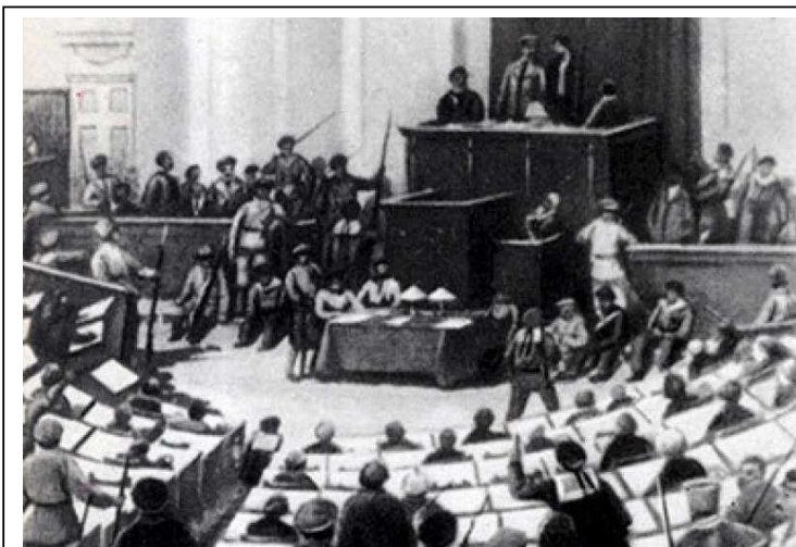
В момент разгона Учредительного собрания.