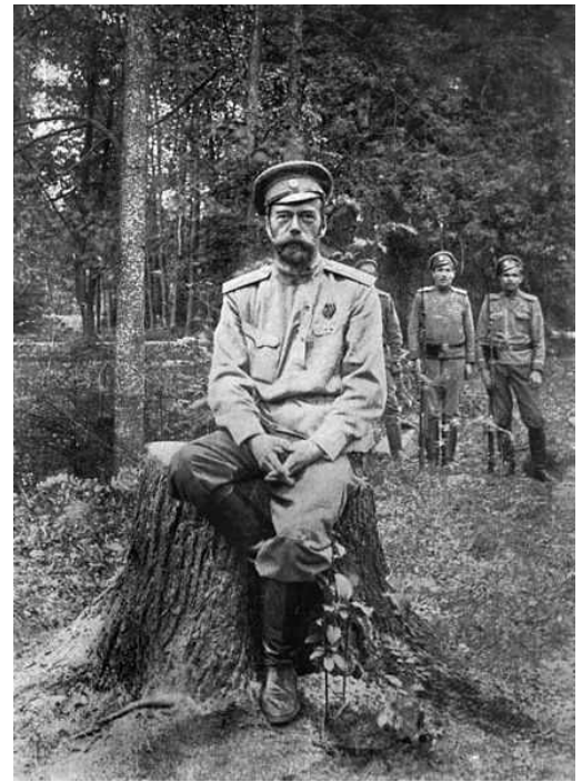
Николай II после отречения от престола в марте 1917 г.

Арест. Вопрос о дальнейшей судьбе царя стал предметом разногласий между Временным правительством, лидерами Государственной Думы и исполкомом Петросовета. Депутаты Государственной Думы первоначально не планировали арест Николая II, а Временное правительство даже предпринимало шаги, чтобы организовать отъезда Николая II в Англию. Однако под давлением Совета Временное правительство уже 7 марта принимает постановление об аресте «отрекшегося императора Николая II с супругой», а 8 марта генерал Алексеев сообщает царю об этом. 9 марта Николай II прибывает в Царское Село, где фактически заключается под домашний арест вместе с