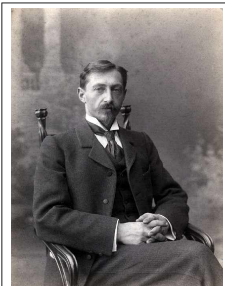
Иван Алексеевич Бунин

и газет. Были основаны свои книжные издательства в Берлине, Париже. Эти издательства выпускали произведения русских писателей-классиков – А.С.Пушкина, Л.Н.Толстого, Ф.М.Достоевского, А.П.Чехова, религиозные книги, учебники для детей, книги современных писателей Русского Зарубежья. Творческая русская эмиграция создавала литературные организации и кружки. В Русском Зарубежье продолжали писать И.А.Бунин (получивший высшую литературную награду – Нобелевскую премию в 1933), А.М.Ремизов, Б.К.Зайцев, И.С.Шмелев, М.И.Цветаева, Г.В.Иванов, Г.В.Адамович и многие другие. Развивалось русское музыкальное искусство, живопись.