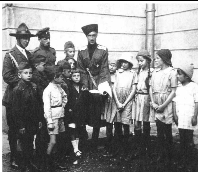
Барон Врангель в Константинополе

корабли. Не все корабли останавливались в порту Стамбула, часть из них следовала дальше – на острова Мраморного и Эгейского морей и на турецкий полуостров Галлиполи. В Стамбуле и на близлежащих островах скопилось самое большое количество беженцев из России. Большинство из них составляли военные.