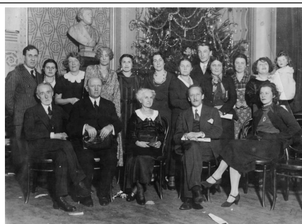
Библиотека им.И.Тургенева в Париже – Елка 25 декабря 1933