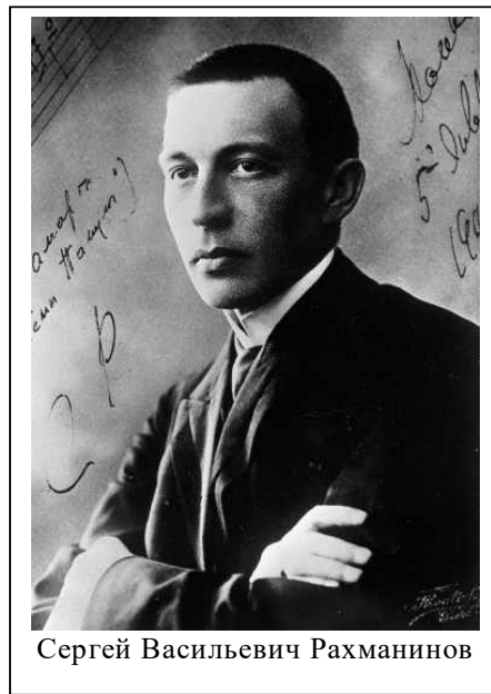
Сергей Васильевич Рахманинов

Россию покинуло множество выдающихся учёных, внесших существенный вклад в фундамент американской науки и технологии: И.И.Сикорский,