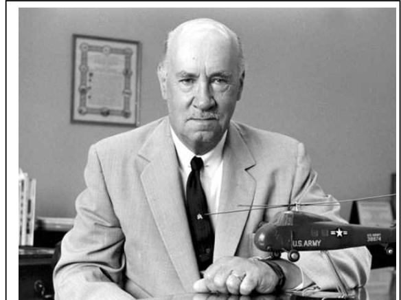
Игорь Иванович Сикорский