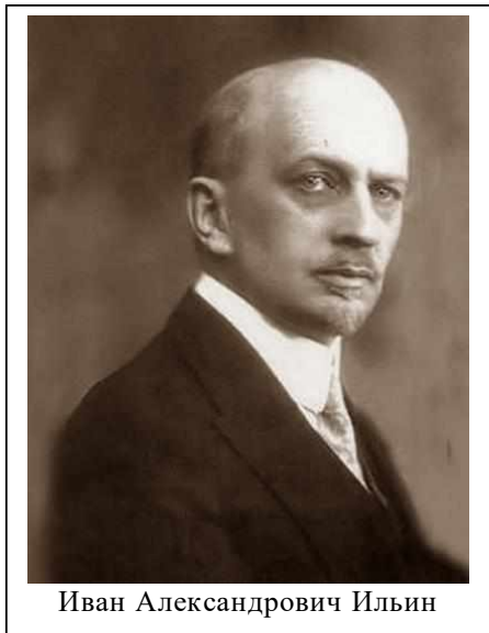
Иван Александрович Ильин

Трудно назвать общую численность русских эмигрантов. По разным данным число людей, покинувших родину в результате Гражданской войны 1918-1922 гг. составило от 2 до 2,5 МИЛЛИОНОВ ЧЕЛОВЕК. Этих людей принято причислять к ПЕРВОЙ (БЕЛОЙ) волне эмиграции.