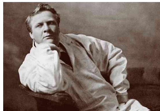
Федор Иванович Шаляпин

Особое значение уделялось образованию детей. В основных центрах Русского Зарубежья возникла сеть начальных и средних школ. В 1924 г. было 90 таких школ. Бойскаутское движение «Русских юных разведчиков» ставило своей