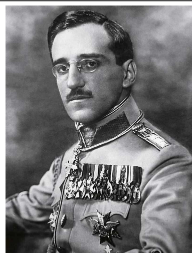
Король Сербский Александр I

Большинство русских из тех, кто оказался в Стамбуле, нашли приют в недавно созданном КОРОЛЕВСТВЕ СЕРБОВ, ХОРВАТОВ И СЛОВЕНЦЕВ (СХС) – будущей Югославии. Королевство распахнуло свои двери перед воинскими подразделениями и многочисленными гражданскими лицами, помогло им обосноваться в крупнейших городах и сельской местности. Близость языков и общность религии способствовали быстрой ассимиляции русских. Сербский Патриарх выступил от имени своей церкви и оказал гостеприимство русским митрополитам и высшему духовенству. В вопросах оказания помощи беженцам активное участие принимал король Александр I , который в свое время воспитывался при русском императорском дворе. Югославия, особенно Белград , стали значительным культурным центром Русского Зарубежья.