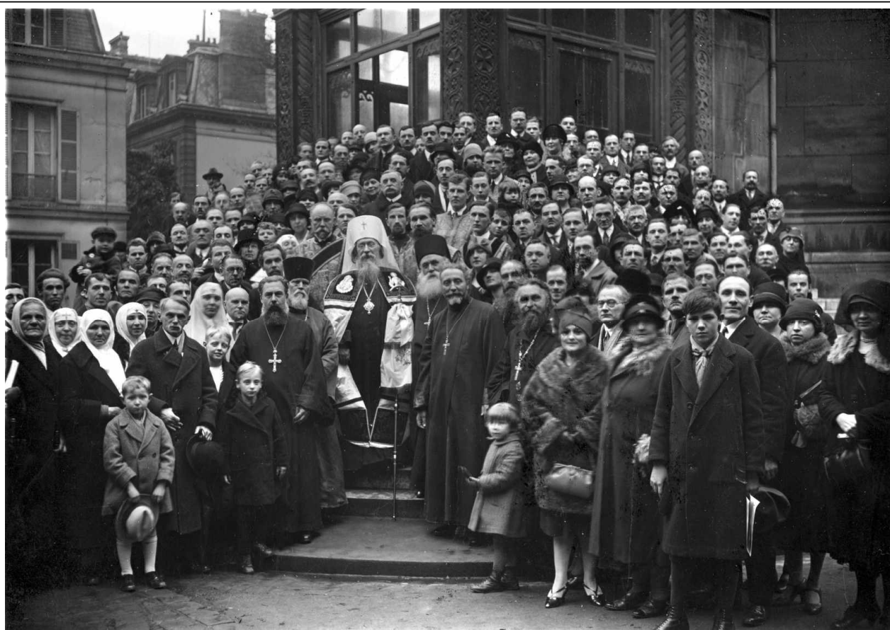
Русские эмигранты с митрополитом Евлогием у входа в собор Александра Невского в Париже

Важный маршрут беженцев из Советской России пролегал через Дальний